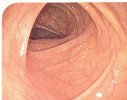
Kvalitně vyčištěné střevo