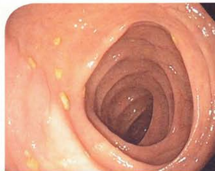
Plošný adenom. Při nekvalitní přípravě, jej lze snadno přehlédnout.